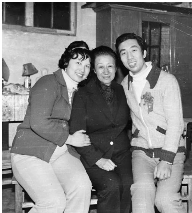
(左) 本书作家杨天昱女士；(中) 联合国经济事务局局长潘玉璞女士； (右) 著名歌唱家杨民昇先生 (杨天昱之夫)。