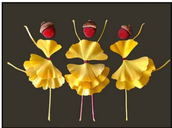
翩翩起舞的女孩們

>> 媽媽在哪裡，家就在哪裡。女兒不管走得多遠，總有那麼一天，是一定要回家的。當我既是媽媽的女兒，又是女兒的媽媽，甚至到了媽媽與世長辭後，我才終於懂得：表達愛的心願，是不能等待的。