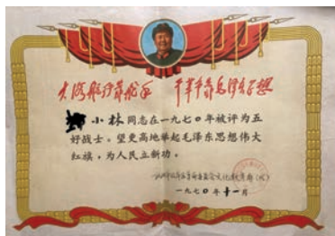
十三岁时，初一学生的我被区文教局评为：五好战士 (政治思想好，军事技术好，三八作风好，完成任务好，锻炼身体好)